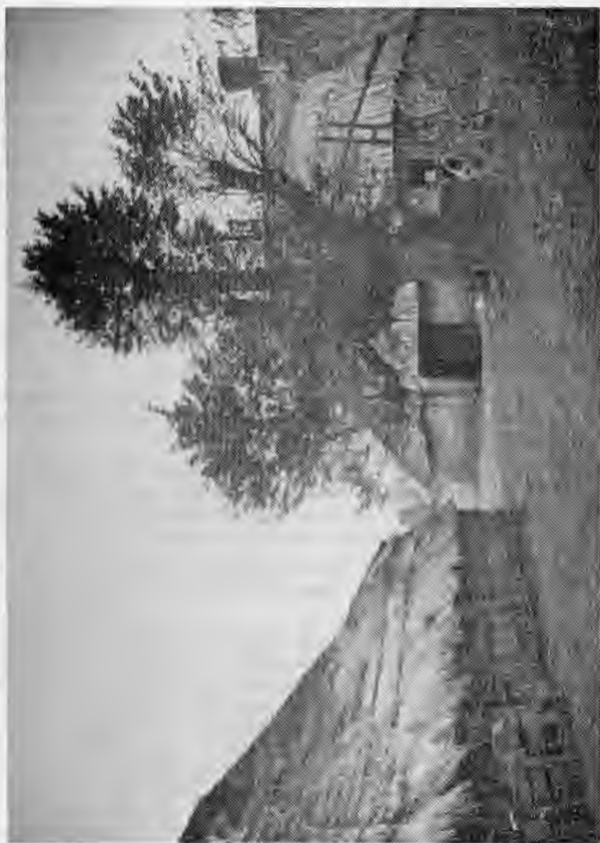
Zonder woorden ....