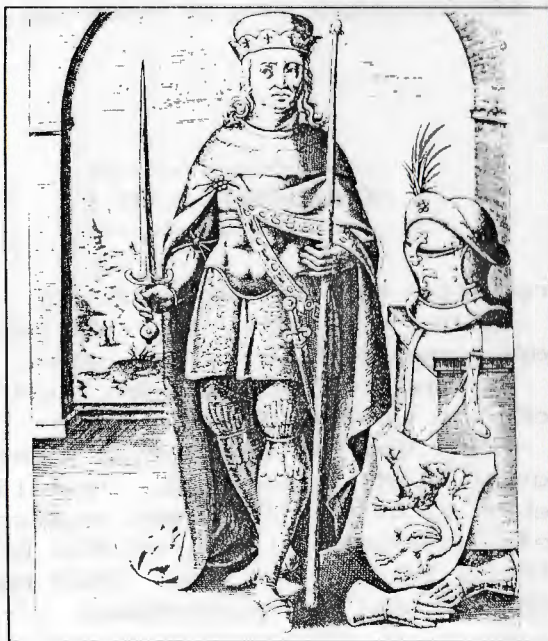
Hertog Hendrik I van Brabant