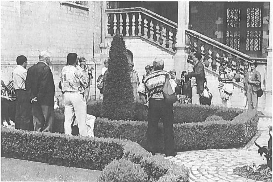
De Hof van Margaretha van Oostenrijk

Mechelen is bekend om haar handgeweven tapijten en beiaardklanken maar ook om haar eeuwenoud cultuurpatrimonium. Onze gidsen namen ons mee op sleptouw door het oude centrum.