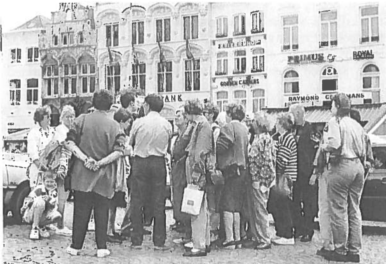
De Grote Markt te Mechelen

Voor het speelgoedmuseum stond twee uur op het programma maar hier hadden we de hele dag wel rond kunnen lopen. Het was werkelijk de moeite waard en we keken onze ogen uit naar al het speelgoed. Met veel speelgoed hadden we zelf nog gespeeld en er kwamen ook leuke anekdotes los. Wie kent nog het verhaal van Koop Bies? Ikke wel, maar dat zal ik u niet vertellen. De Slag bij Waterloo, waar onze Napoleon verslagen werd, was prachtig in beeld gebracht. Duizenden soldaatjes stonden op het slagveld, gewonde paarden, kapotte kanonnen, verwoeste gebouwen, werkelijk een slagveld.