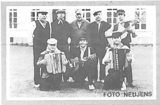
DE NIJLENSE FOLKLOREZANGERS - TEL. 03/481.84.38

Dit belooft weer een oergezellige Kempische avond te worden en de Heemkundekring zorgt ervoor!