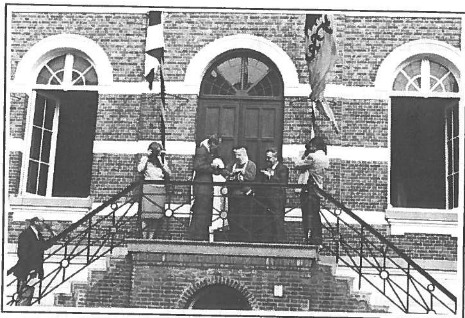
De belangstelling voor de opening was groot