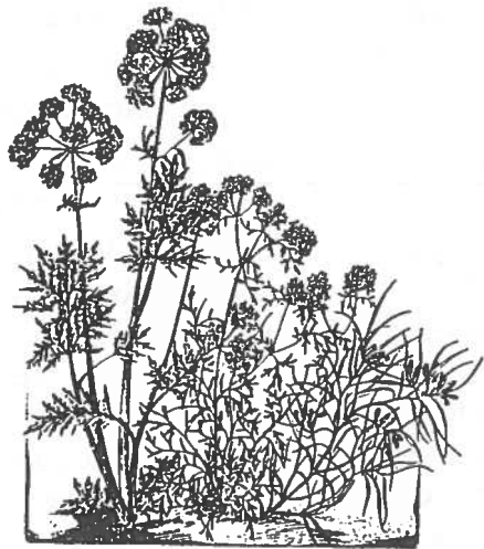
Karwij Koriander Komijn