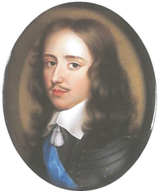
Willem II, de oudste zoon van Amalia

Tijdens de vredesonderhandelingen van Münster overleed Frederik Hendrik, wat Prins Willem II de titel opleverde van