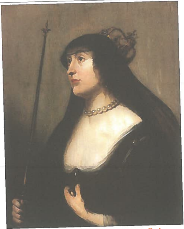
Elizabeth, koningin van Bohemen