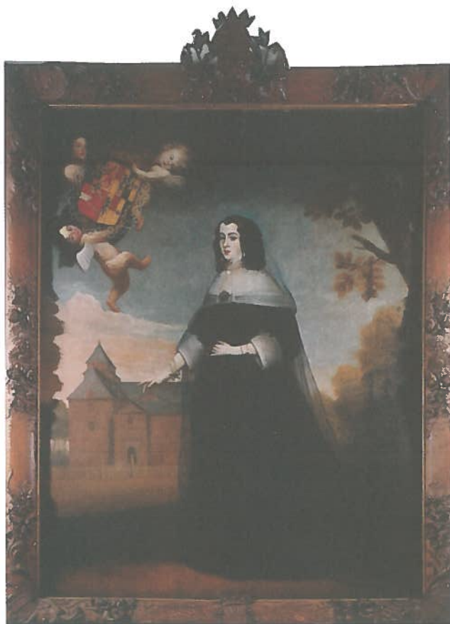
Het grote portret van Amalia in het Stadhuis van Turnhout