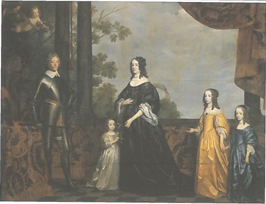
Amalia, Frederik Hendrik en hun dochters Albertina Agnes, Henriëtte Catharina en Maria.

uiteindelijk, ondanks haar hevig verzet, uitgehuwelijkt aan een achterneef met een lagere status: Keurvorst Frederik Willem van Brandenburg (°16 februari 1620,+09 mei 1688). Zij trouwden op 7 december 1646. Uit hun huwelijk stammen de latere koningen en keizers van Pruisen en Duitsland. Louise Henriëtte is ook de grootmoeder van Frederik de Grote, Tsaar van Rusland.