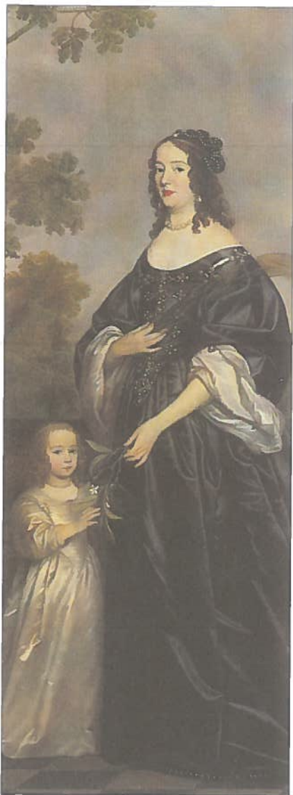
Amalia en prinses Maria

was met Spanje. Prinses Maria trad op 23 september 1666 in het huwelijk met Maurits Lodewijk Hendrik, Paltsgraaf van Simmern (°1640,+1673). Zij stierf in Kreuznach op 20 maart 1688.