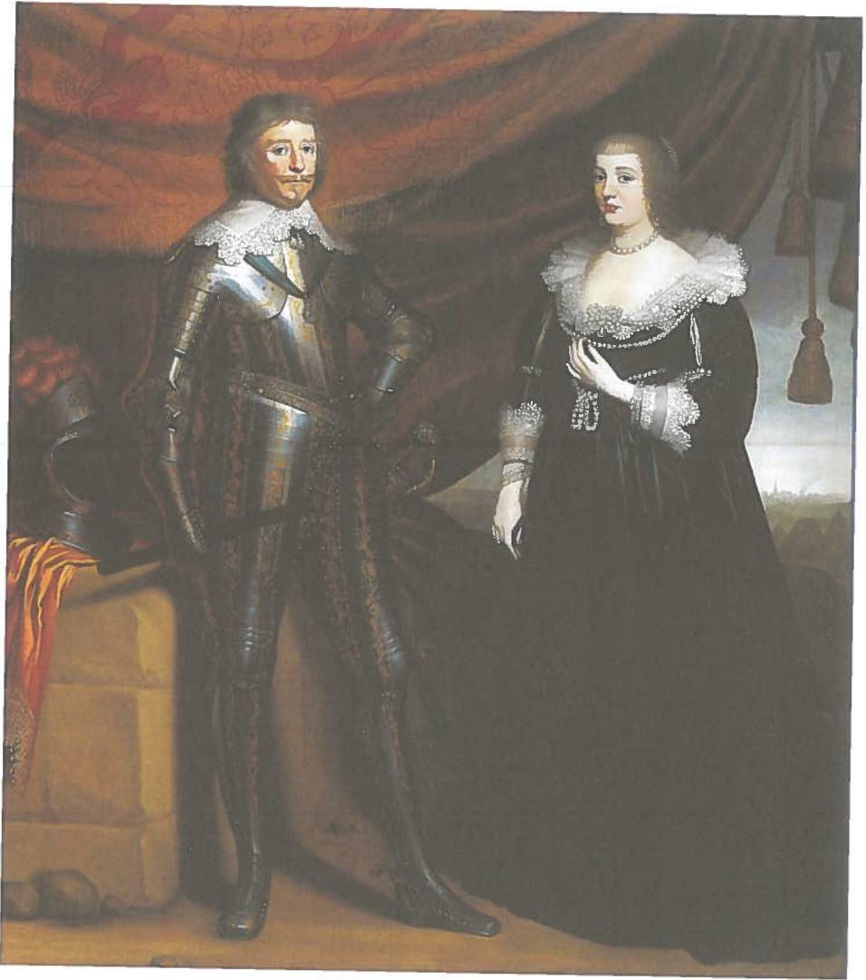
Portret van Frederik Hendrik, Prins van Oranje, en zijn vrouw Amalia van Solms Braunfels