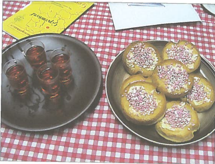
Ook in het Heemhuis werd de geboorte van Prinses Amalia gevierd.

Wij zijn bijzonder trots dat gekozen is voor de naam Amalia, afkorting en troetelnaam van onze vereniging! Door middel van deze extra editie van ons tijdschrift "Van Wirskaante" besteden wij aandacht aan deze heuglijke gebeurtenis.