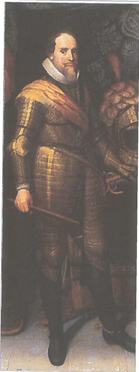
Maurits, Prins van Oranje

Bij een van zijn minnaressen verwekte Frederik Hendrik een zoon. Maar hij weigerde, net als de verstokte vrijgezel Maurits, zich aan één vrouw te binden. In 1625 echter lag de oude Stadhouders op sterven en riep hij zijn halfbroer bij zich. Maurits gelastte Frederik Hendrik onmiddellijk te trouwen en te zorgen voor wettige nakomelingen, anders zou het Huis van Oranje uitsterven. Maar Mooi Heintje, die al eenenveertig jaar was, wenste een vrije man te blijven. Woedend dreigde de doodzieke Maurits ermee dat hij dan zelf zou trouwen. Hij had minstens acht bastaarden verwekt en kon hen tot erfgenamen en opvolgers benoemen. Dit gaf de doorslag: Frederik Hendrik haastte zich naar de hofdame van de Winterkoningin en vroeg haar ten huwelijk. Amalia van Solms aarzelde geen moment. Hoewel zij geen bruidschat inbracht, was zij toch een acceptabele bruid. Zij was niet van geringere afkomst dan haar verloofde.