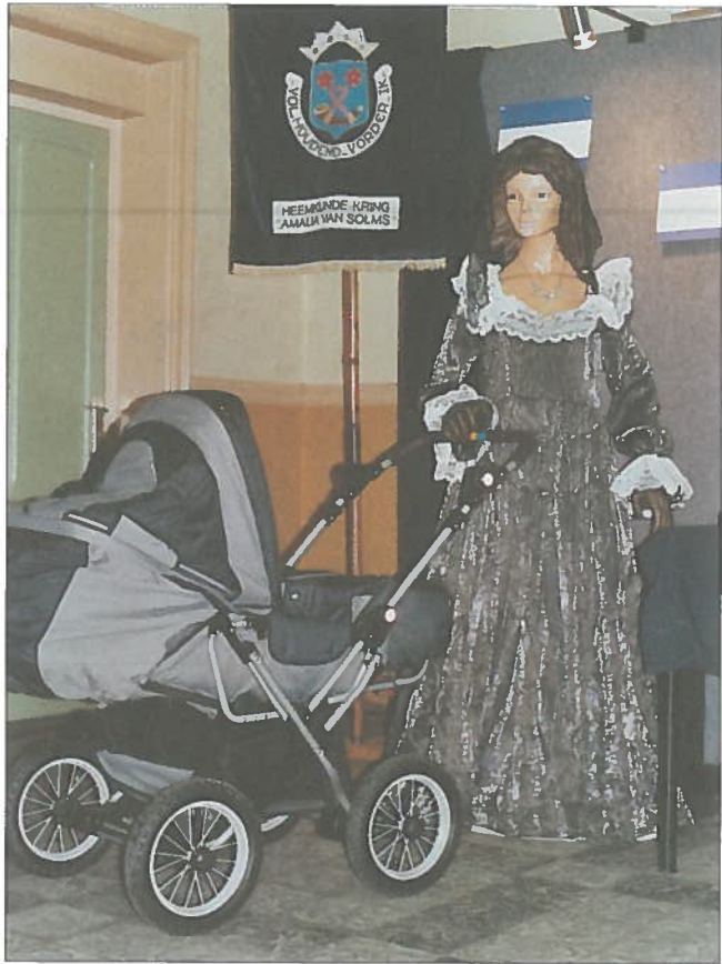
Amalia van Solms gaat wandelen met haar bet-bet-bet-...achter-achter-achter-...kleinkind Amalia!