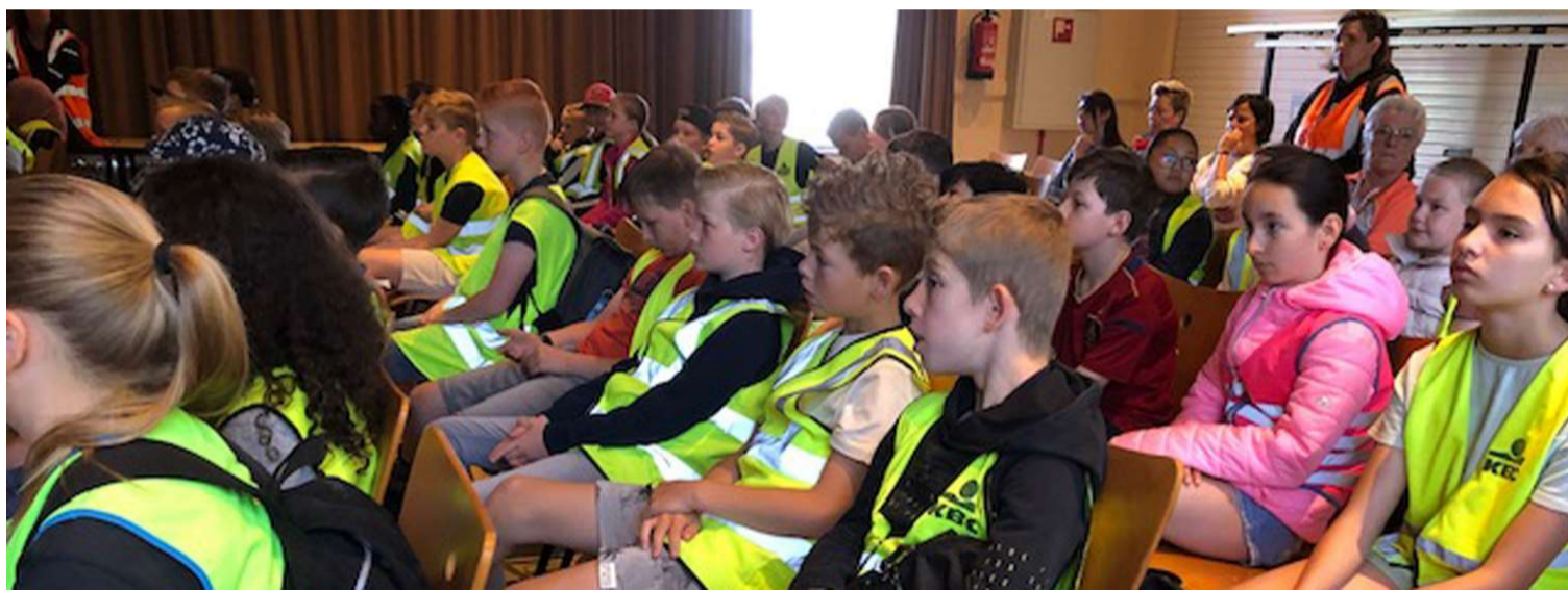
Aandacht voor het verhaal over oorlogen

Maandag 9 mei zijn de eerste Vredesdagen (10 en 12 mei volgen er nog twee) gestart voor de hoogste klassen van de basisscholen in Baarle (De Vlinder, andere dagen De Uilenpoort, De Bernardusschool, De Horizon en 't Spoor in Weelde Statie). Er wordt aandacht besteed aan WO I, aan de Dodendraad, het vredesmonument en schakelhuis in Zondereigen, er wordt een bezoek gebracht aan de Draaischijf en het vluchtelingenspel wordt gespeeld. Hieronder twee foto's van de beginpresentatie in het cultuurcentrum Baarle.