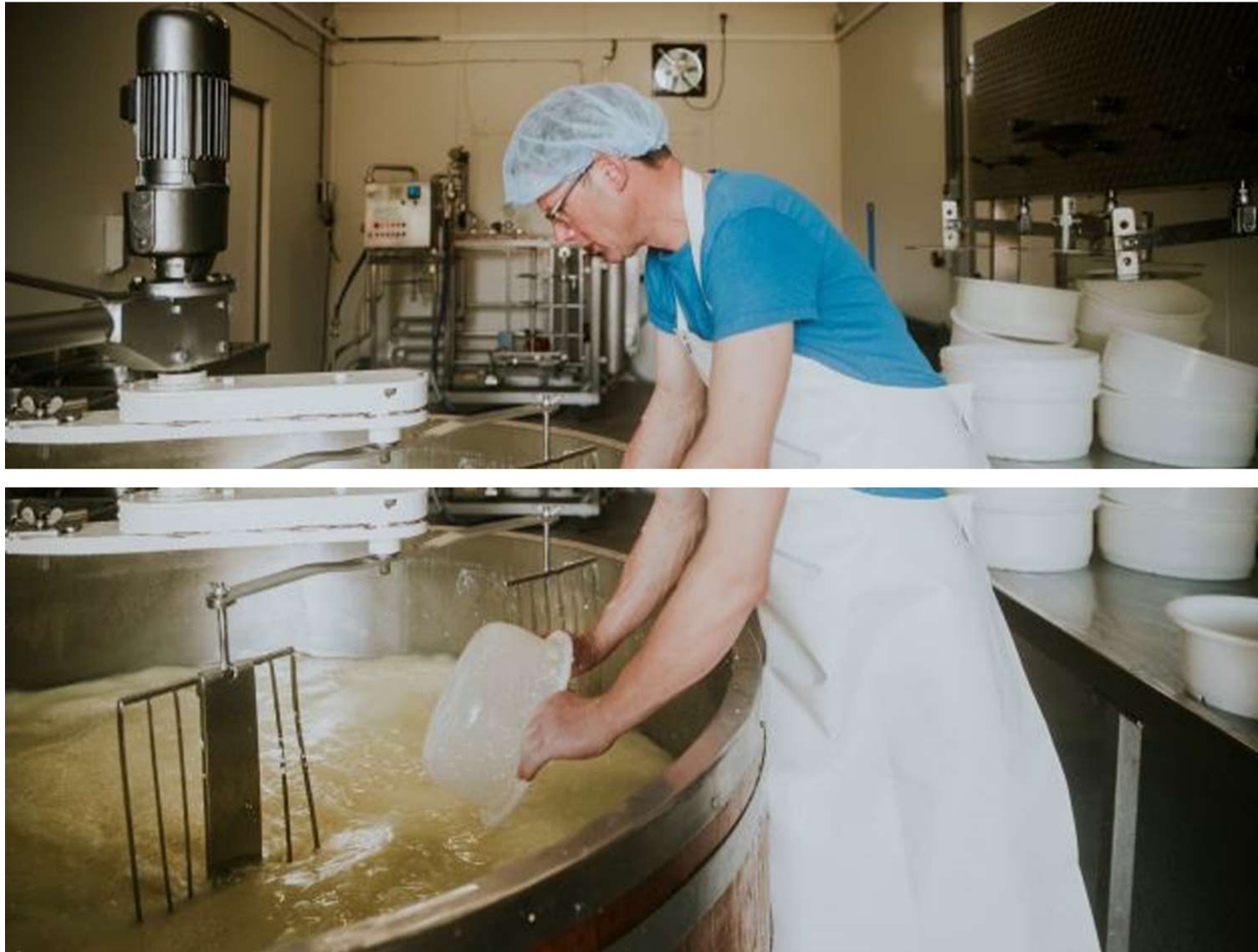
Foto kaasmakerij Kukeleko

Inschrijven gaat als volgt: meld je aan via secretaris@amaliavansolms.org en geef duidelijk aan met hoeveel personen je wilt deelnemen, naam, adres en telefoonnummer/mailadres waar je bereikbaar bent. De bijdrage per persoon is 25 euro voor de lunch en barbecue: dit bedrag graag overmaken naar bankrekeningnr. IBAN: NL13 RABO 0103 8949 69 BIC: RABONL2U met vermelding van Heemdag. Je aanmelding is pas afgerond als je betaling binnen is!