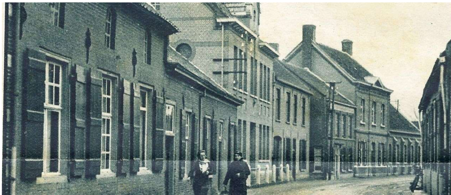
De Kerkstraat ca. 100 jaar geleden (1915, Jos Jansen)

Als u het boek straks doorkijkt, leert u Baarle beter kennen en waarderen. Maar ook zal u duidelijk worden dat Baarle in de afgelopen 100 jaar ontzettend is veranderd. Altijd ten gunste? Dat bepaalt u zelf!