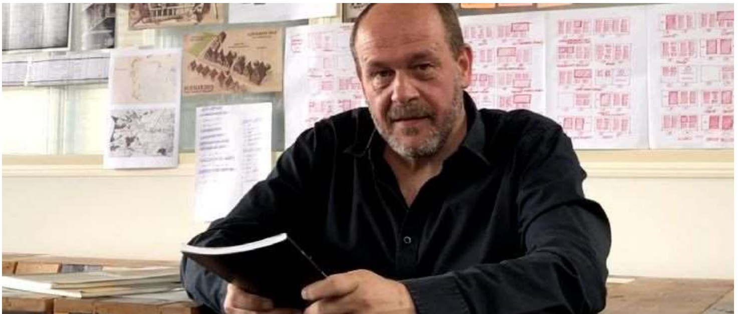
Auteur/onderzoeker Jean-Pierre Kin.