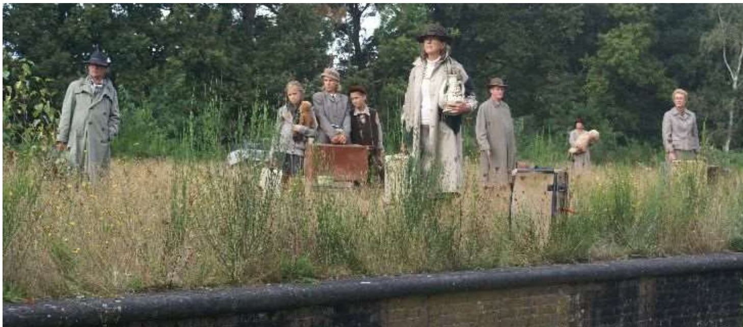
Het perron aan de grens in 2014....

Zet beide activiteiten alvast in je agenda. Je zult er geen spijt van hebben. In de volgende nieuwsbrief vind je er meer informatie over.