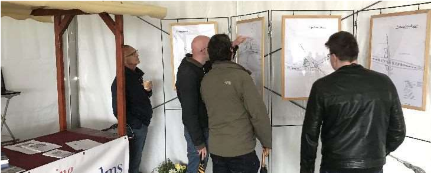
De inrichtingsvoorstellen voor de overhoeken werden nauwkeurig bestudeerd

Amalia was zaterdag 7 september de hele dag met een stand aanwezig in de grote tent op het parkeerterrein van drukkerij De Jong ter gelegenheid van de opening van de Randweg. Met passende informatie: op een zevental panelen waren de ideeën die Amalia in het kader van Roggerentjes 2018 heeft ontwikkeld voor de herinrichting van de overhoeken die bij de aanleg van de Randweg zijn overgeschoten. V bezochters stonden er bij stil, vonden het heel goed dat er voorstellen voor waren ontwikkeld, en stelden soms ook alternatieven voor. Deze week gaat Amalia de voorstellen samen met de gemeente Baarle-Nassau en andere partijen uitwerken. U hoort er ongetwijfeld nog van.