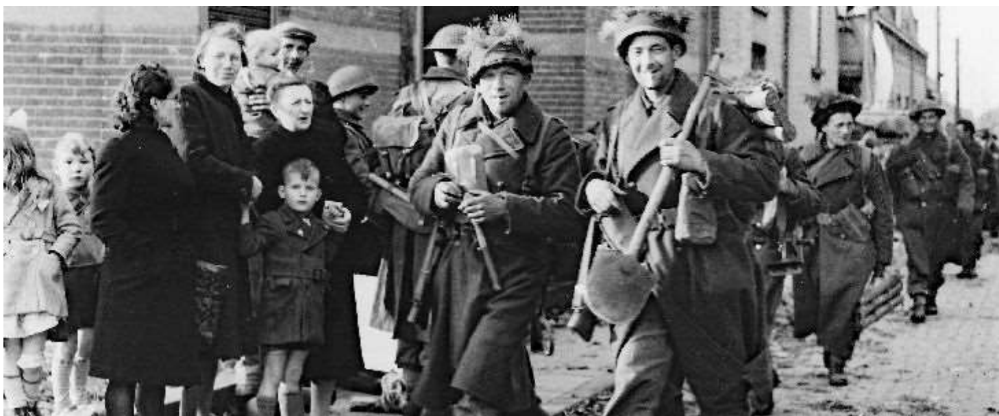
Poolse soldaten in Gilze op 27 oktober 1944.