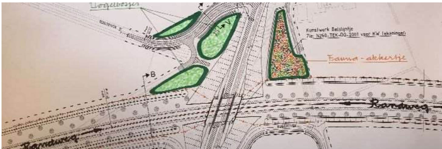
Voorstel van Amalia voor de inrichting van overhoeken bij de kruising van de randweg met het Bels Lijntje.

Naast het standje van Amalia is op het Volksfeest een standje van Erfgoed Noorderkempen te vinden. Zij geven graag wat extra uitleg over het archeologisch onderzoek dat ten behoeve van de aanleg van de randweg heeft plaatsgevonden. U kunt er voor een vriendenprijsje enkele 'oude' Van Wirskaantes meenemen, met artikelen over de resultaten van het archeologisch onderzoek dat al weer enkele jaren geleden heeft plaatsgevonden.